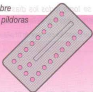
Sobre 21 píldoras